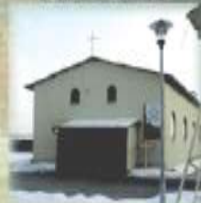
Przeworsk, pw. Chrystusa Króla