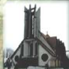
Przeworsk – Gorczyzna